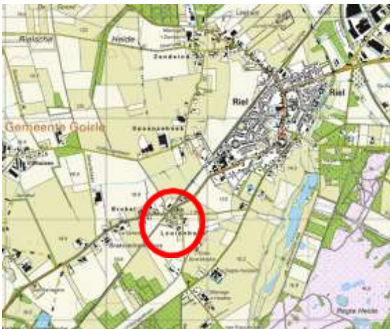
Figuur 1-1: situering Looienhoek 1 Riel