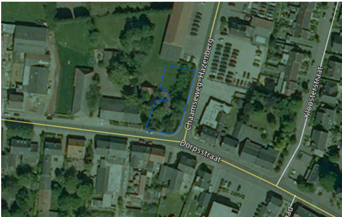
Afbeelding 1: ligging plangebied

Men is voornemens 3 nieuwe woningen te realiseren op de plaats van de tuin.